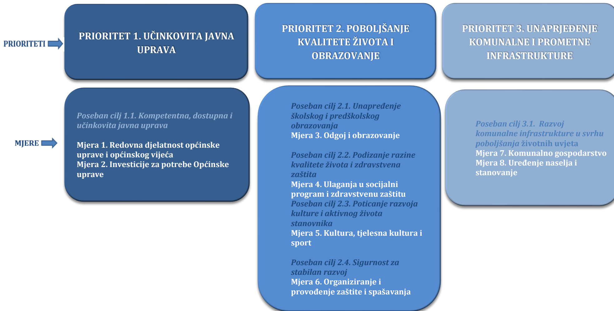
Slika 2. Pregled temeljnih strateških prioriteta i mjera